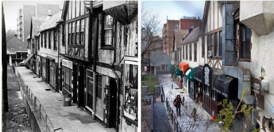
Eleventh Hour, un bar dans Queens, New York

http://www.criticalcommons.org/Members/carrierentschler/clips/death-scream-genovese-murder-reenactment/view reconstitution de la nuit