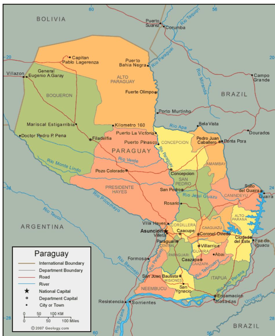
(Carte du Paraguay, sur Carte du monde)

Pourtant, très rapidement, Stroessner dénonça la subversion marxiste à tel point que Richard Nixon,, en visite à Asunción, le 4 mai 1958 le qualifia de « champion de l'anticommunisme ». 12