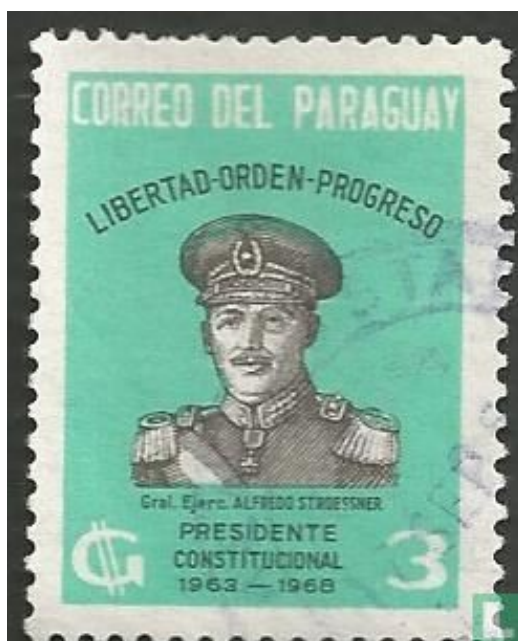
Timbre de 1963