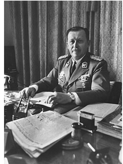
Alfredo Stroessner

Au Paraguay l'état de siège est exceptionnellement levé dimanche pour vingt-quatre heures, à l'occasion des élections générales. Plus exactement, il s'agit de la réélection du général Alfredo Stroessner, qui règne depuis huit ans déjà sur le plus isolé et le plus secret des pays d'Amérique du Sud (407 000 kilomètres carrés, 1 800 000 habitants). Personne à Assomption n'a en effet le moindre doute sur l'issue d'un scrutin que le " président de la nation " a soigneusement organisé, comme ceux de 1954 et de 1958, mais cette fois avec les nouveaux perfectionnements qui sont de rigueur lorsqu'on tient à bénéficier de la manne de l'Alliance pour le progrès.