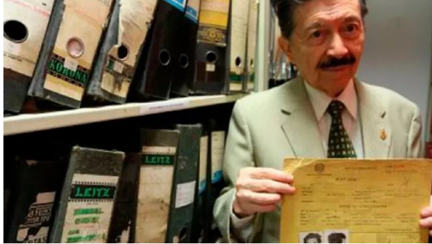
L'avocat et militant des droits humains Martin Almada a découvert en 1992 des «archives de la terreur».

Rappelons ici que Martin Almada, célèbre victime de la dictature qui a plus tard été le principal protagoniste de la découverte des archives de la terreur, est décédé en mars 2024.