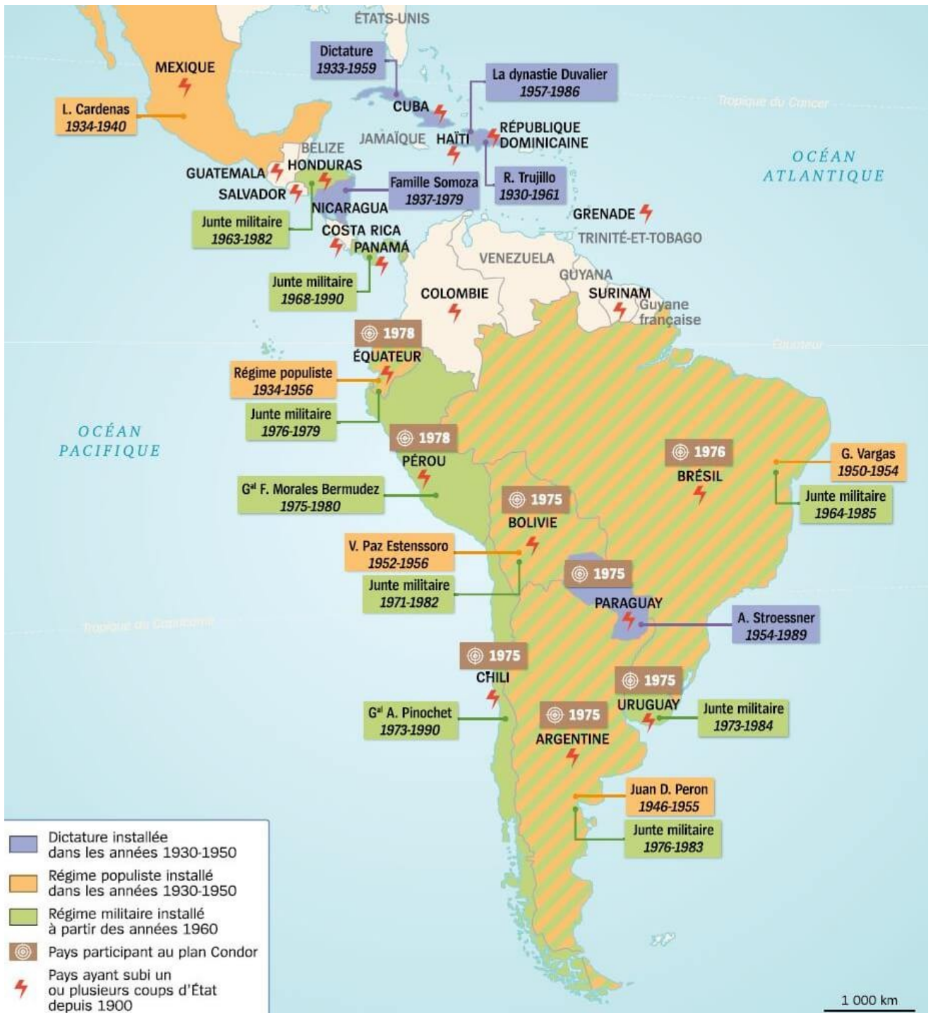
Les régimes autoritaires en Amérique latine, 1930-1990 (Revue L'Histoire, janvier 2019)