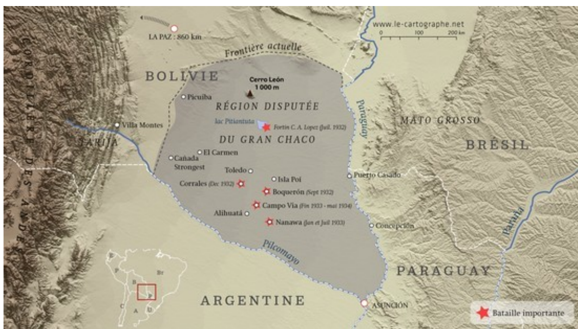
La guerre du Chaco (1932-1935)

Le Gran Chaco est la partie la plus inhospitalière du Chaco boréal. Immense territoire de plus de 240 000 km 2 , qui s'étend de la rivière Paraguay aux contreforts de la cordillère des Andes, il est en grande partie inhabité. Il s'agit d'une région aride, semi-désertique, où l'on peut rencontrer quelques unes des plus hautes températures enregistrées en Amérique du Sud. Le Gran Chaco occidental, près des montagnes, est une plaine sans eau, dotée d'une végétation clairsemée. Plus à l'est, la végétation se densifie mais reste toujours aussi aride et toute progression dans ces clairières herbeuses devient quasiment impraticable. Si la densité de population est faible, celle des insectes "piqueurs" ne l'est pas. Les maladies tropicales se portent bien dans cette région... 5