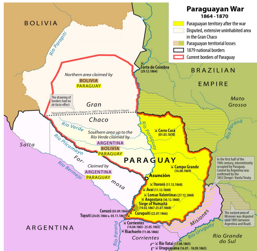
Carte de la guerre de la Triple-Alliance (1864-1870) - Wikipedia

1864-1870 : Guerre de la Triple Alliance contre le Brésil, l'Argentine et l'Uruguay.