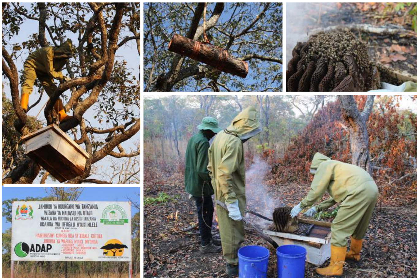
Récolte de miel dans la région d'Inyonga.