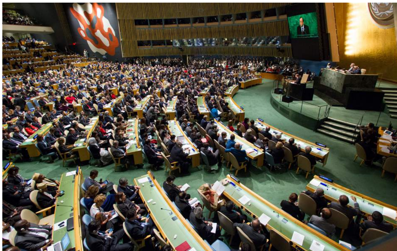
La 70 e session de l'Assemblée générale des Nations Unies, à New York. C'est le 25 septembre 2015 qu'a été adopté le Programme de développement durable à l'horizon 2030.

Autant de pistes de réflexion pour contribuer à construire un monde plus durable.