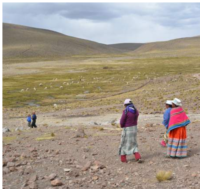
Les hauts plateaux de la région andine d'Arequipa.

L'action de GeTM répond aux ODD nos 5 et 6 qui visent l'égalité entre hommes et femmes, ainsi que l'accès à l'eau salubre et à l'assainissement.