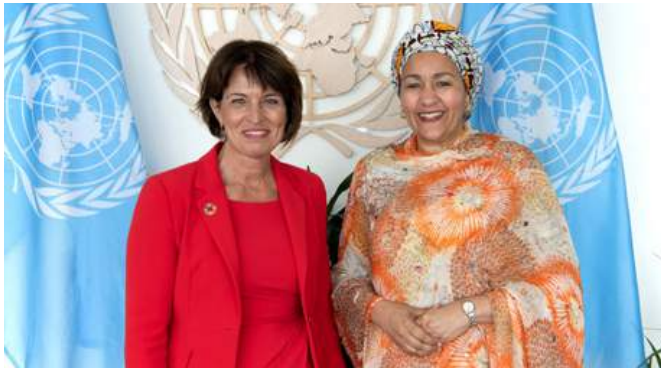
La conseillère fédérale Doris Leuthard avec la vice-secrétaire générale des Nations Unies Amina Mohammed, lors du Forum politique de haut niveau pour le développement durable de l'ONU, à New York, le 17 juillet 2018.

L'autosatisfaction du Conseil fédéral n'est pas complètement usurpée. La dernière édition de l'indice de développement humain 11 place par exemple la Suisse à une 3 e place plutôt bonne, derrière la Norvège et l'Australie.