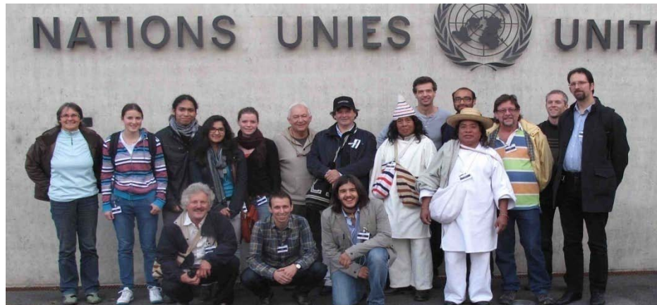
Rencontre avec les Indiens Kogis (Colombie), visite de l'ONU avec des enseignant-e-s et des élèves