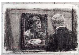
William Kentridge Drawing for City Deep (Soho Gazing at Portrait) , 2019, fusain et crayon de couleur sur papier, 80 x 120 cm. © William Kentridge, avec l'aimable autorisation de l'artiste et de Goodman Gallery, Johannesburg