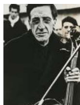
Robert Capa Ancien membre de la Philharmonie de Barcelone dans un camp pour réfugié-e-s espagnol-e-s, France, 1939 © Magnum Photos