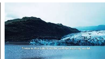
Marco Donnarumma Niranthea , 2023, film still, single channel video, 4K, color, duration: 25'. © Marco Donnarumma