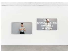
Christine Sun Kim & Thomas Mader Tables and Windows , 2016, double projection vidéo © Kim & Mader, avec l'aimable autorisation des artistes et François Ghebaly, Los Angeles / New York