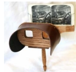
Reproduction d'un stéréoscope de Holmes