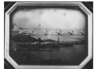
GROS, J.-B.-L., Pont et bateaux sur la Tamise , 1851, Source : Bibliothèque Nationale de France.