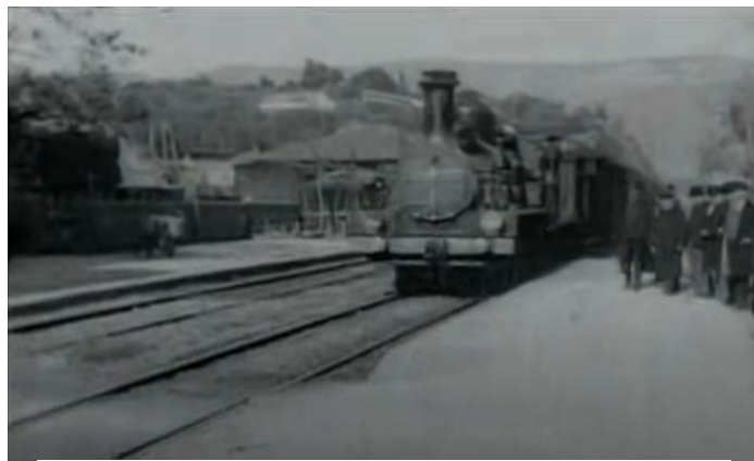
Capture d'écran, L'Arrivée d'un train en gare de La Ciotat , 1895