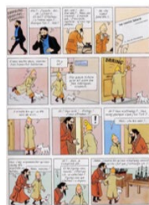
mise en page irrégulière (rhétorique)