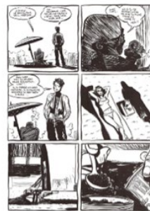
mise en page régulière (gaufrier)

La bande dessinée peut être étudiée à travers différents aspects. Il y a l'approche thématique (ou référentielle) qui va se concentrer sur l'analyse du récit et le déroulement de la narration. On peut également choisir une approche plus technique en abordant la construction de l'image et comment elle occupe l'espace dans la case (vignette) ainsi que sa disposition sur la page (planche). L'utilisation de la double-planche permet de créer une mise en scène particulière riche de sens. L'articulation de l'image sur la page construit le regard et amène une interprétation vis-à-vis de l'histoire. Une piste pour les élèves serait de commencer par identifier les différentes typologies de mise en page.