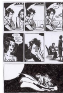
mise en page semi-régulière architecturée