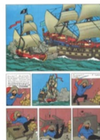
mise en page semi-régulière architecturée

Baroni, Raphaël (2022), « Une typologie des mises en page pour l'enseignement de la bande dessinée », GrBED.