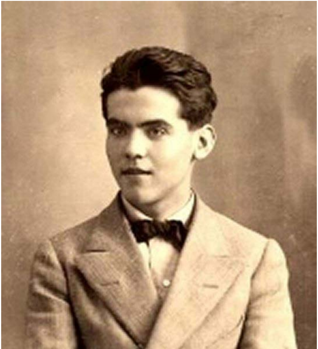
Federico Garcia Lorca en 1914