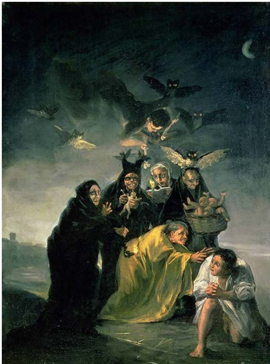
Francisco de Goya – Le Sabbat des sorcières