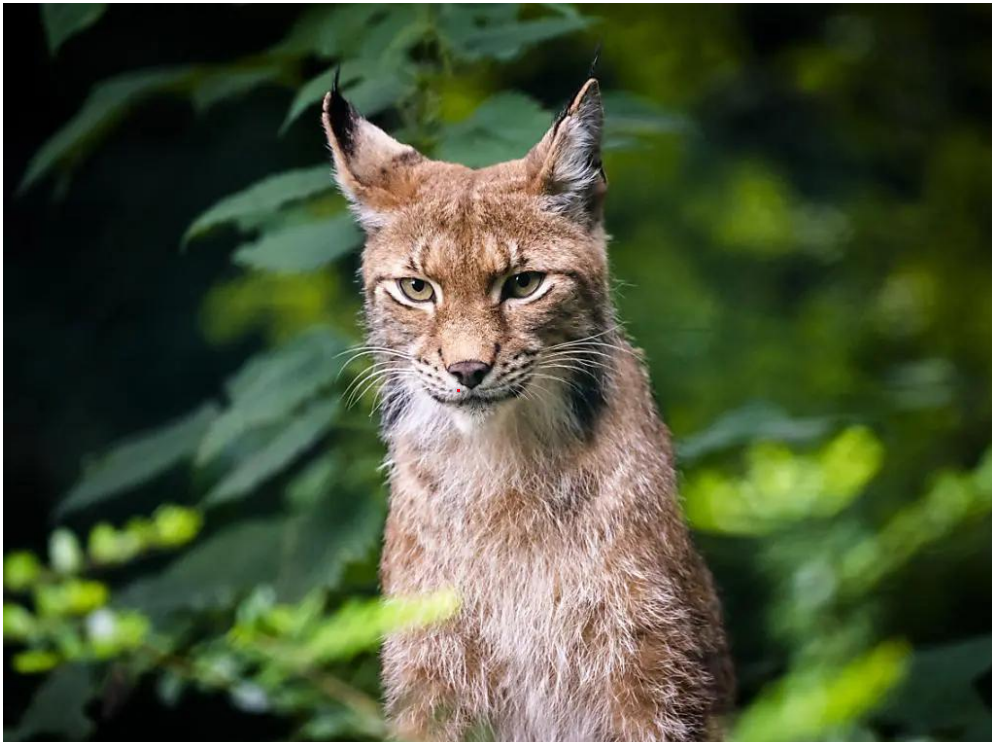
1. Lynx suisse dans son habitat naturel.

La survie des lynx en Suisse n'est pas encore assurée. Le lynx est protégé par la loi. Mais il continue d'être abattu illégalement.