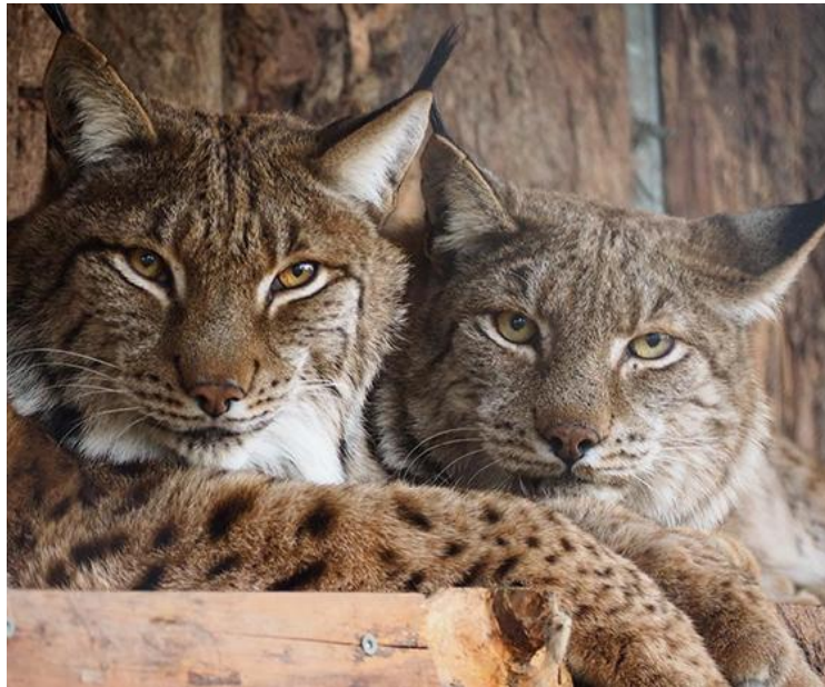
3. Les deux lynx du Bioparc, à Bellevue.

Cet endroit accueille deux lynx. Ils sont nés en captivité en Suisse. Ils proviennent d'une confiscation par le vétérinaire cantonal de Zurich. Ils habitaient chez un homme qui aujourd'hui a 83 ans et qui ne pouvait plus s'en occuper.