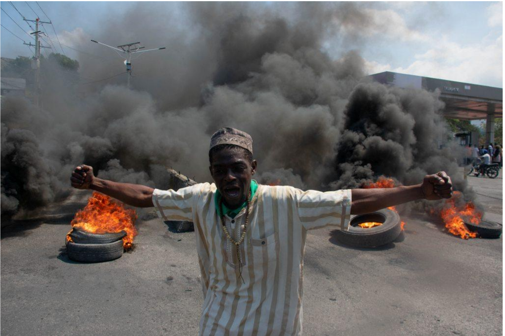
Violence et chaos en Haïti en crise