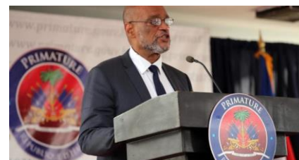
Le premier ministre actuel d'Haïti, Ariel Henry

L'ONU a également commencé à distribuer des vivres et des produits de première nécessité aux quelque 15 000 personnes qui ont dû fuir Port-au-Prince ces derniers jours. Cette violence, qui a déjà coûté la vie à 1193 personnes depuis le début de l'année, est décrite comme "insoutenable pour le peuple" par le Haut-Commissaire des Nations Unies pour les droits de l'homme, Volker Türk.