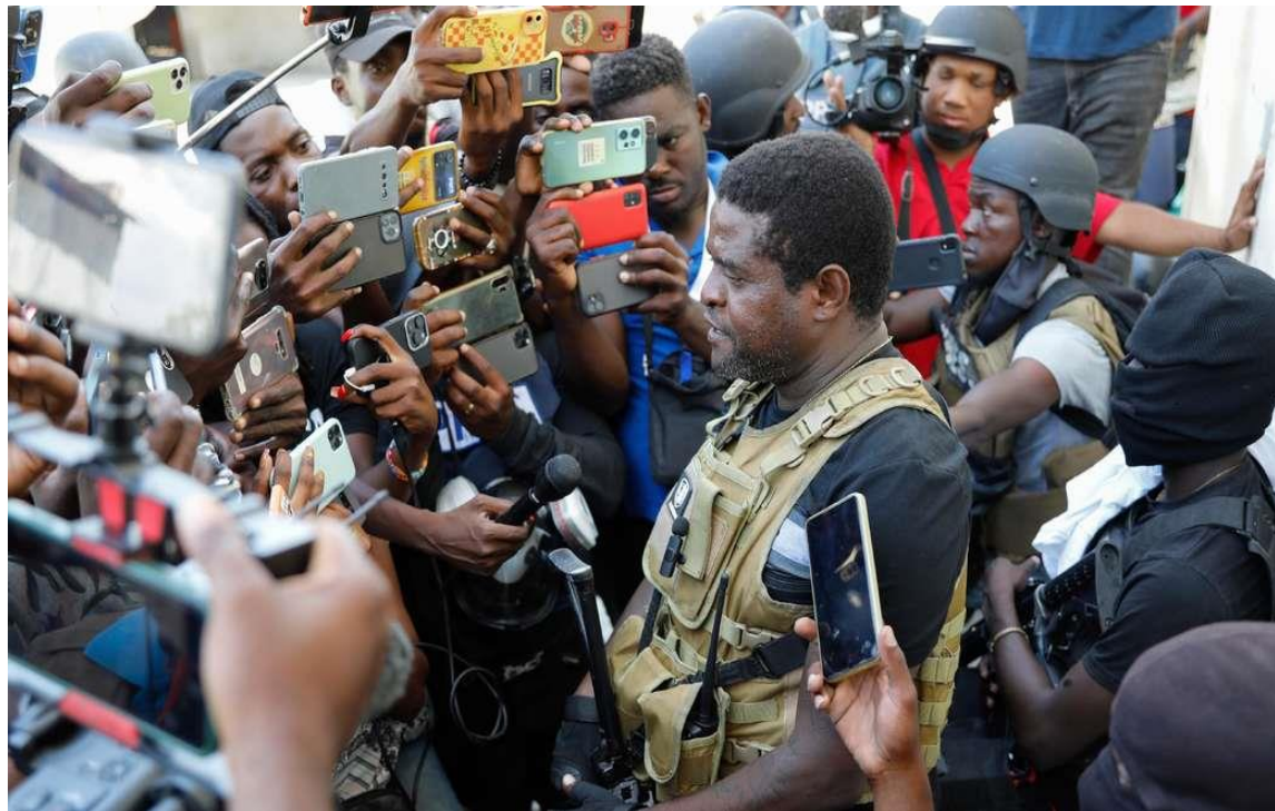
Jimmy Chérizier en interview.