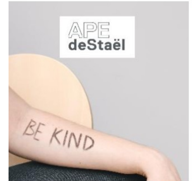
Prix de bienveillance