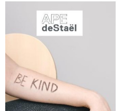
Prix de bienveillance