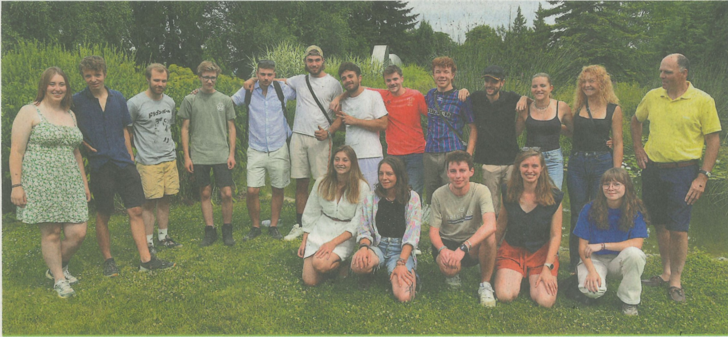
La volée 2025 des apprenties et apprentis ayant obtenu le diplôme de l'École d'horticulture de Lullier.