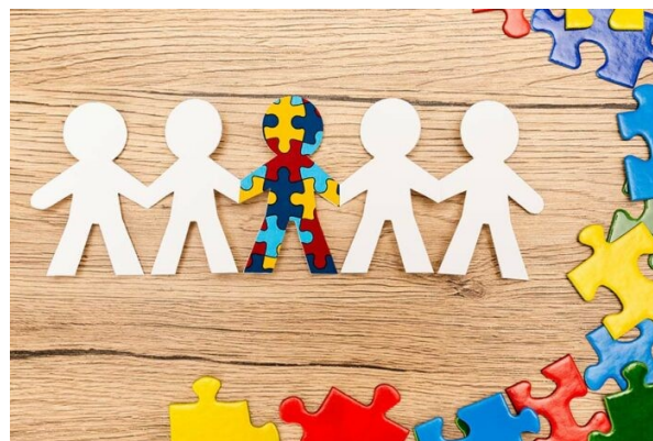
Développer la compréhension pour faciliter l'inclusion des personnes autistes au quotidien