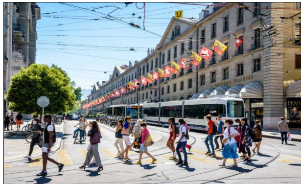
Cohabitation entre les piétons et les trams