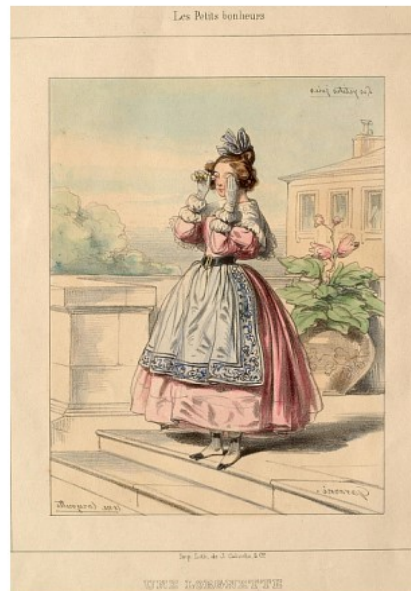
« Les petits bonheurs des demoiselles, NO. VI: une lorgnette » Lithographie (1814-1866) de Paul Gavarni