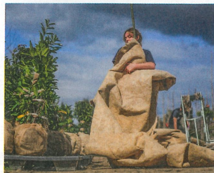
Une formation solide et emballante !