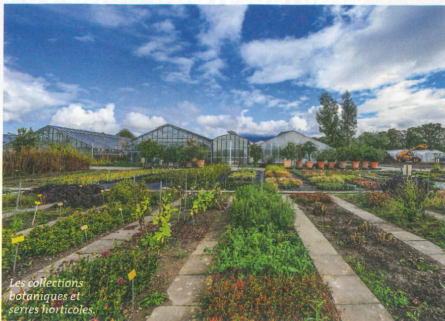
Les collections botaniques et serres horticoles.