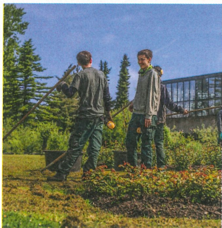
Paysagistes sur le terrain.

végétal, du paysage et de la nature. L'école de renommée européenne assure une formation complète dans cinq domaines : pépinière, floriculture, paysage, maraîchage et arboriculture fruitière. Depuis 1994, s'ajoutent une école pour fleuristes ainsi que des cours de floriculture et de paysage pour des apprentis. Le Centre de Lullier, qui célèbre ses 50 ans, organise, les 21 et 22 septembre prochains, des portes ouvertes, mais le domaine et ses collections végétales sont accessibles au public toute l'année.