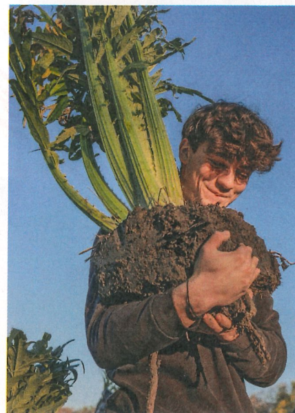
Maraîcher en devenir.