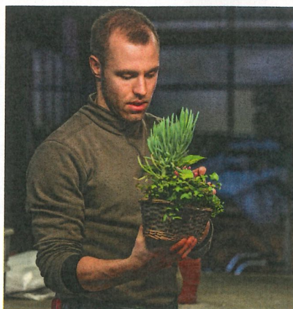
Floriculteur à la main verte.