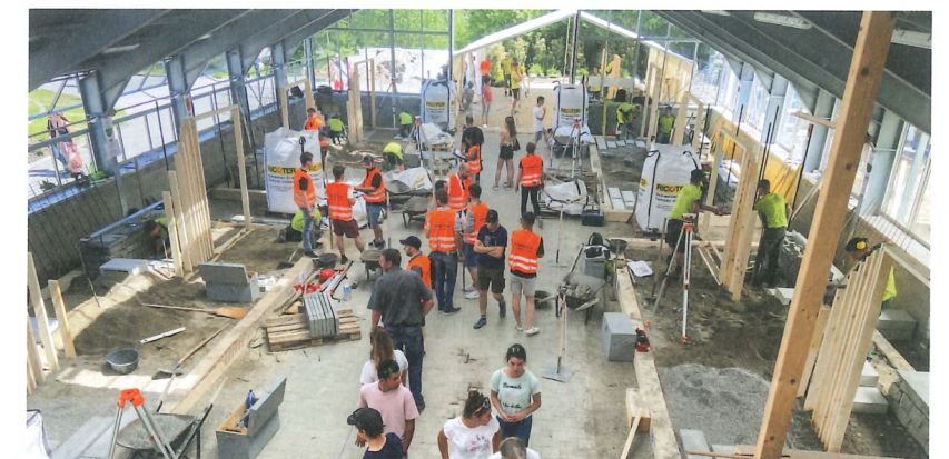
Les chantiers des jardins en début de réalisation, sous l'œil des examinateurs (vestes rouges) et du public, lors de l'édition du concours 2022, à Fribourg.