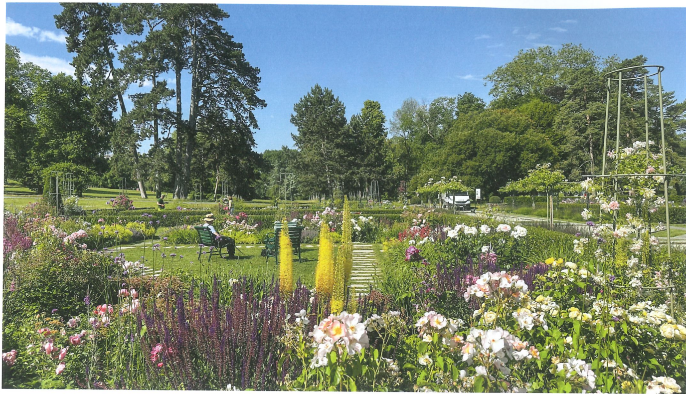
Plus de 400 pieds de rosiers de quelque 200 variétés différentes ont été plantés en 2021 dans la roseraie du Parc La Grange, accompagnés de 4000 fleurs variées, plantes vivaces et bulbes.

allées du parc montrera les apprentis dans leurs multiples occupations sur le terrain et en toutes saisons.