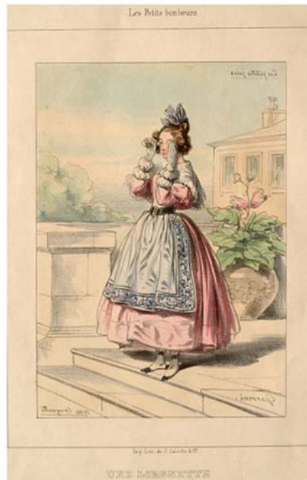
« Les petits bonheurs des demoiselles, NO. VI : une lorgnette » Lithographie (1814-1866) de Paul Gavarni