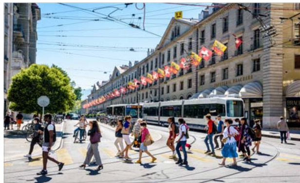
Cohabitation entre les piétons et les trams