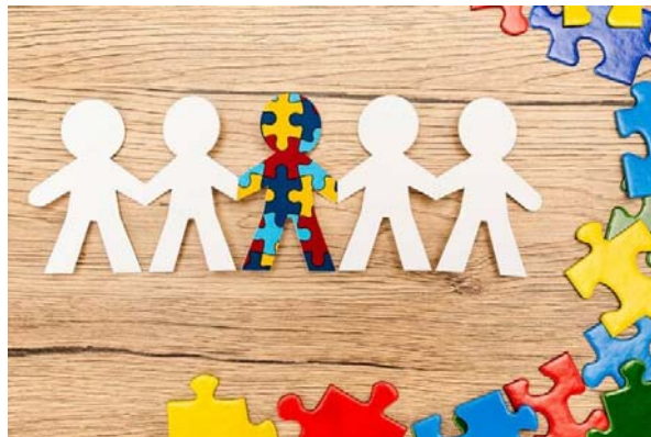
Développer la compréhension pour faciliter l'inclusion des personnes autistes au quotidien