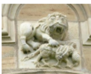
Gurk - Basilisk.jpg (2048x1536) (fracademic.com)

- Sculpture sur la cathédrale de Gurk, en Autriche, représentant le basilic, symbole de Satan, tué par un lion, symbole du Christ.