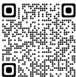
CECG Madame de Staël