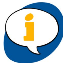
séances d'information et portes ouvertes