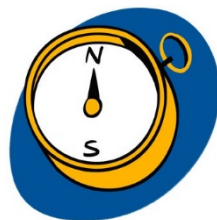
conseils personnalisés au cycle d'orientation