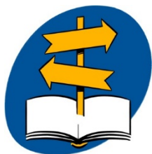
guide d'inscription (flyer)

Consultez les informations ci-dessous ainsi que le guide d'inscription ; échangez avec votre enfant, son conseiller en orientation et les enseignants du cycle d'orientation, interlocuteurs privilégiés accompagnant l'élève dans son choix.