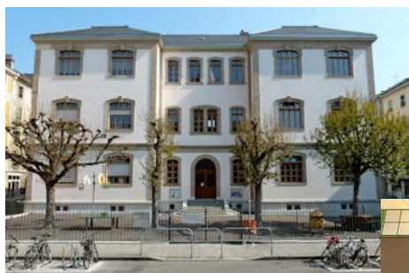
Ecole de Zurich