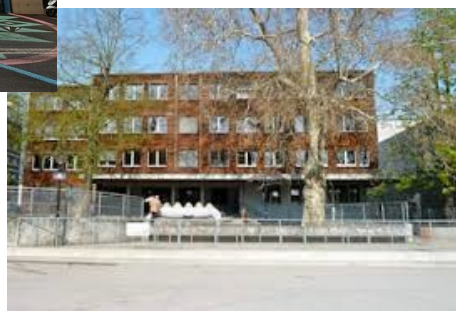
Ecole de De-Chateaubriand